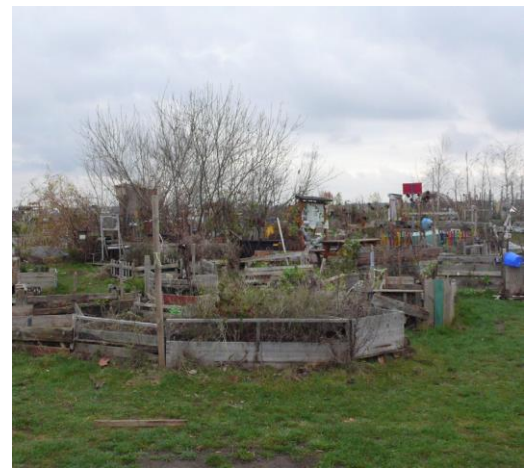
Foto 5 - Huttenplatz stadstuin, Kassel, Duitsland.