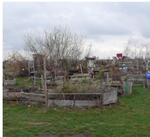
Foto 3 – Gemeenschappelijke tuin Allmende-Kontor 1 , Berlin, Duitsland.