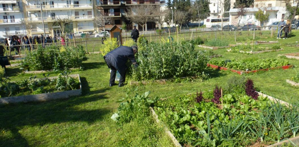
Foto 2 - Kipos3 buurttuin, Thessaloniki, Griekenland.