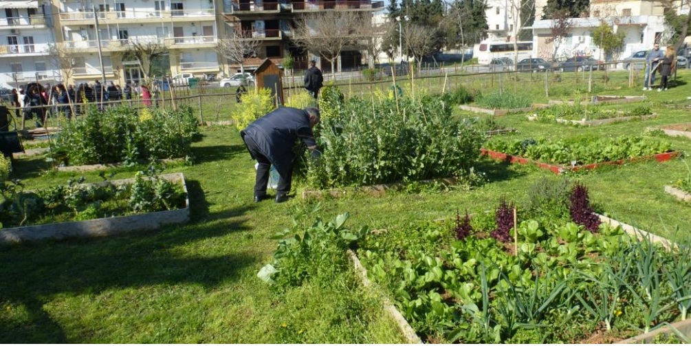
Foto 4 - Prinzessinnen buurtmoestuin, Berlijn, Duitsland.