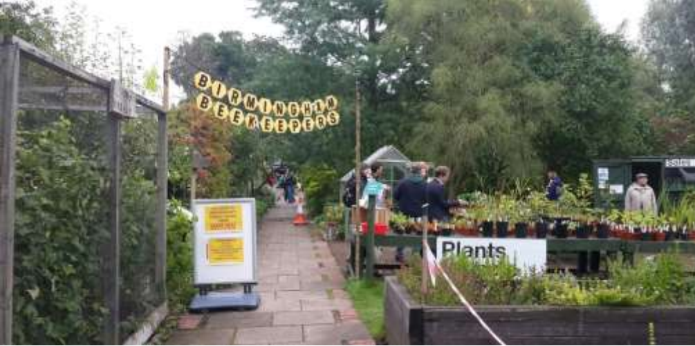
Foto 6 - Volkstuinenpark Quinta da Granja, met het recreatiepark vooraan en teelt van gewassen aan de achterzijde, Lissabon, Portugal.