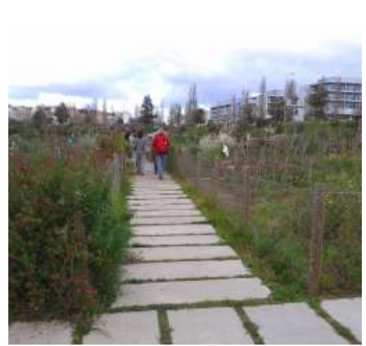
Foto 7 - Volkstuinenpark Quinta da Granja, Lissabon, Portugal.