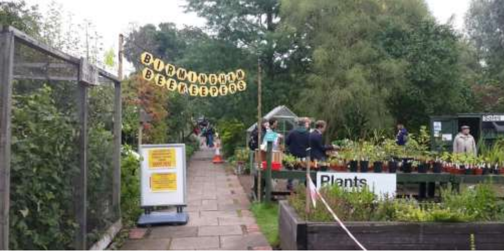
Foto 2 – Imkers evenement open voor publiek, Martineau Gardens, Birmingham, VK.