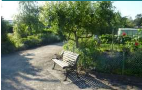
Foto 4 – Bankjes op openbaar terrein, Hanbruch volkstuinen, Aken, Duitsland.