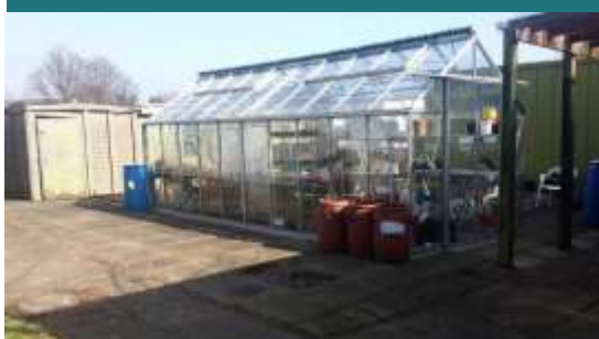
Foto 5 – Gemeenschappelijke kas, Walsall Road volkstuinen, Birmingham, VK.