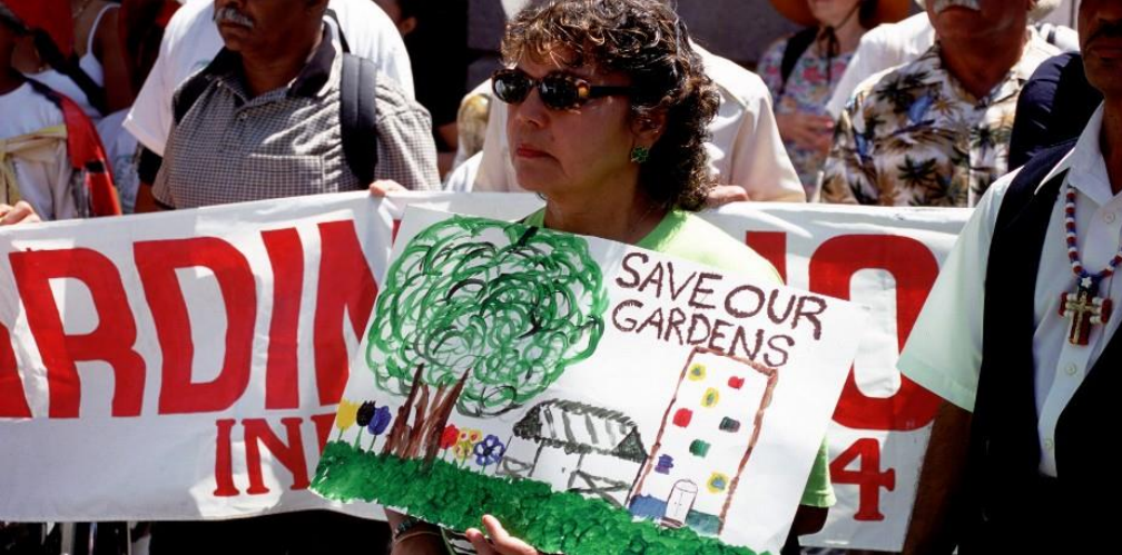
Foto 6 - Bengaalse vrouwen komen op voor hun tuinen, Ipswich, VK.