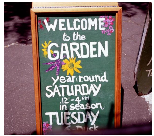
Foto 3 - Tuinenpark Groenewoud (De Hoge Weide), Utrecht, Nederland.