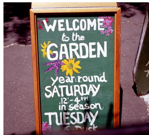
Foto 7 - Tuinders zorgen voor nestgelegenheid voor wilde bijen.