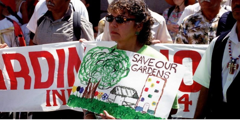
Foto 2 - Demonstranten tegen de vernietiging van buurttuinen in New York City.