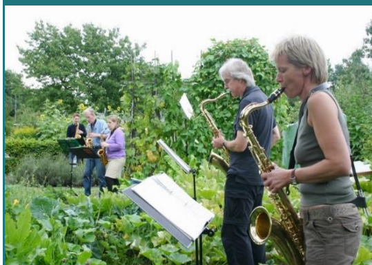
Foto 8 - Muziek sessie in een moestuin van de Langemarck volkstuinten, Münster, Duitsland.