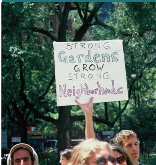
Image 4 - Demonstranten tegen de vernietiging van buurttuinen in New York City.