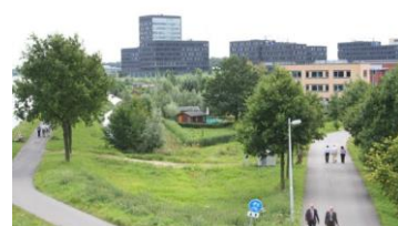
Foto's 9 & 10: Volkstuinenpark "Park Groenewoud" in Utrecht, Nederland.