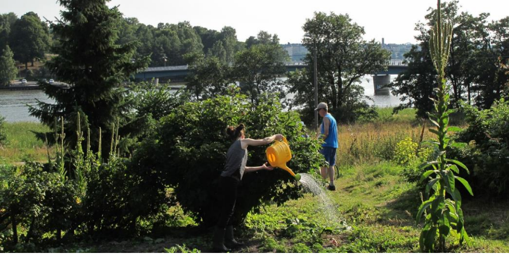
Foto 2 – Het besproeien van de tuin tijdens een gemeenschappelijke bijeenkomst in het Mustikkamaa Edible park, Helsinki, Finland.