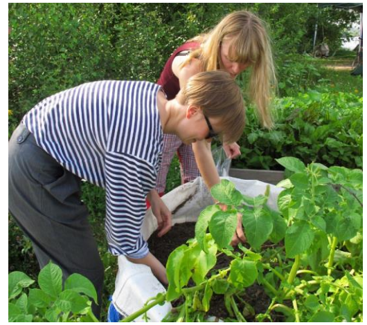
Foto 5 – Kinderen leren over aardappelen, in Tampere, Finland.